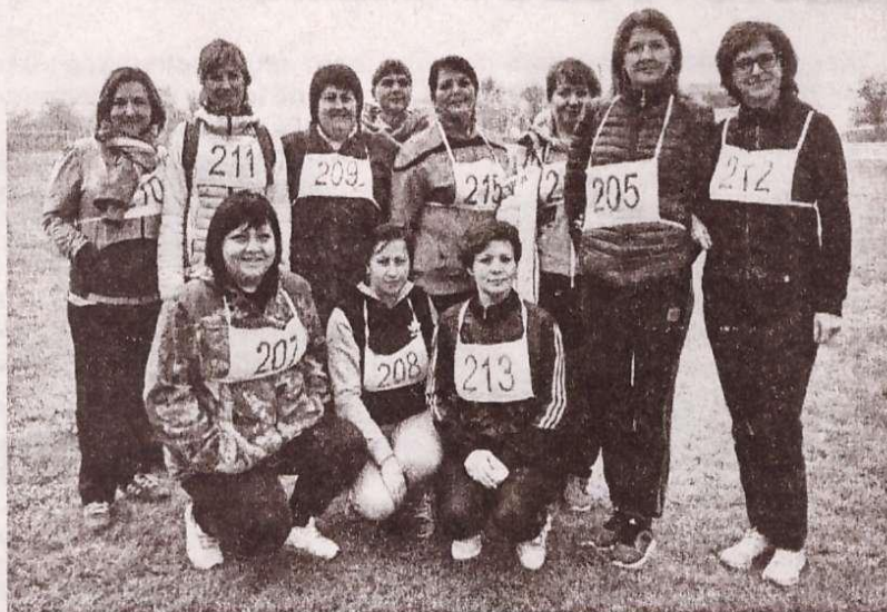
Преподаватели довольны результатами.