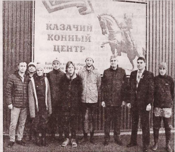
Фото на память о посещении Казачьего конного центра.

Увлечение актера лошадьми стало неотъемлемой частью его жизни, и на гонорар от сериала про Мишку Япончика он приобрел трех лошадей: Гротеска, Медового и Валдая,