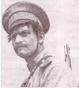
Григорий Мелехов - эпизод из фильма.

ноября в Константиновском районе побывал актер, режиссер и сценарист Евгений Ткачук - исполнитель роли Григория Мелехова в телесериале «Тихий Дон» режиссера Сергея Урсуляка.