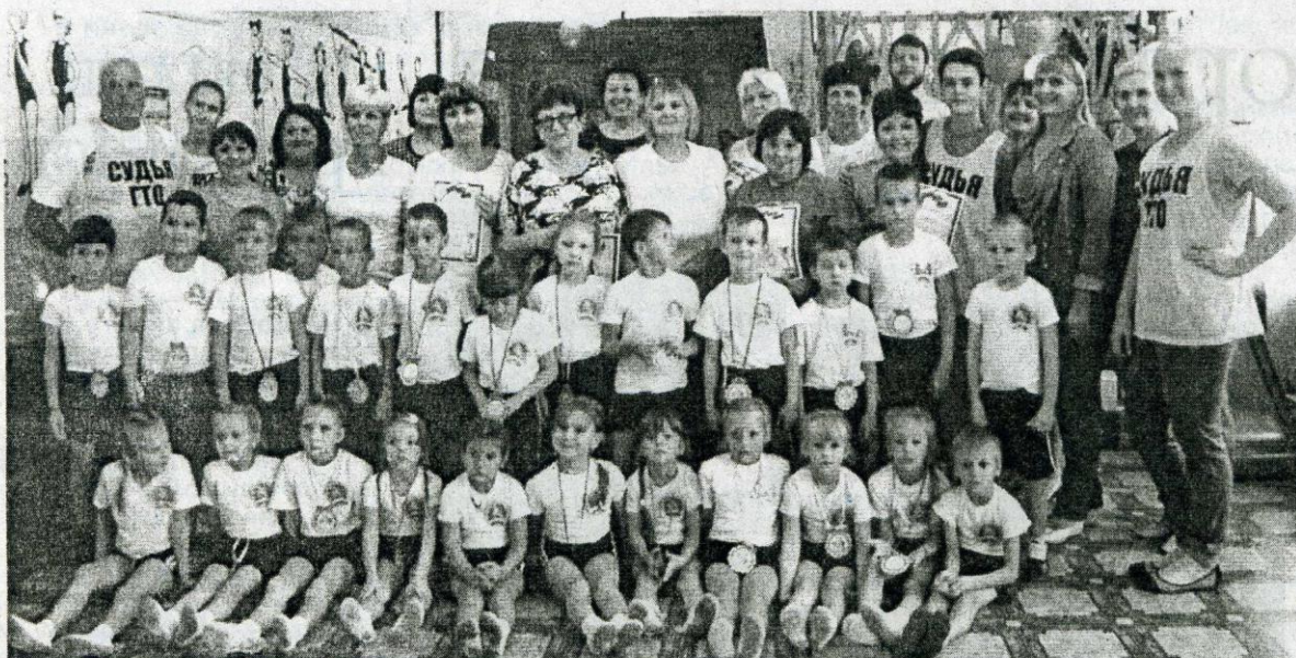
Фото на память о спортивной встрече.

Сдача норм Всероссийского физкультурно-спортивного комплекса «Готов к труду и обороне» обретает все большую значимость и популярность в нашем обществе.