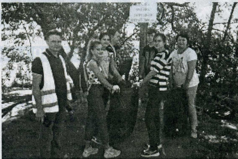
На уборке прибрежной зоны.

В рамках Всемирного дня чистоты и областного проекта #ЭкоБатл учащиеся КСОШ № 1 и студенты КонстПК убрали от мусора часть прибрежной зоны в районе бывшего поста ГАИ.