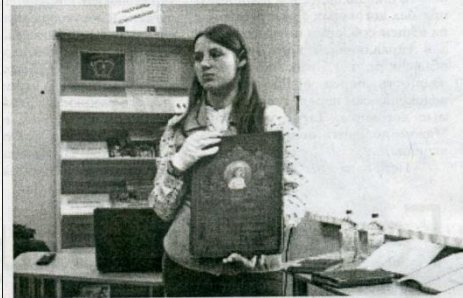
Презентация книги-альбома 1915 года издания.

В Константиновске прошел областной фестиваль «Наука в открытом доступе: педагогика».