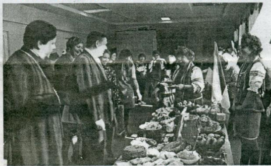
Угощения от украинской культуры (Авиловское поселение).