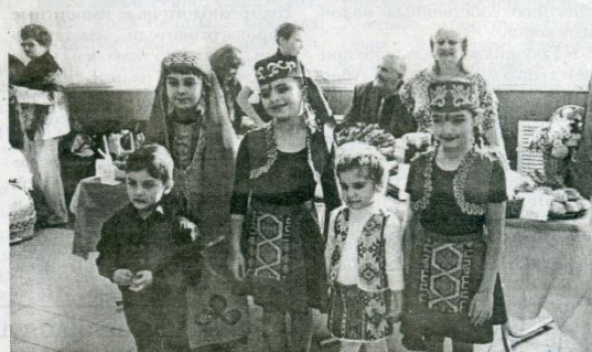
Юные представители культурной автономии «Урарту».