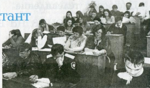
Идет этнографический диктант.

В ходе диктанта его участникам было предложено ответить на 30 вопросов на знание многообразия национальных культур и традиций народов, проживающих в России (20 федеральных и 10 ре-