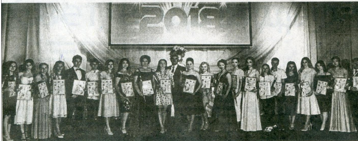
Выпускники, окончившие школу с золотой медалью. Фото на память.