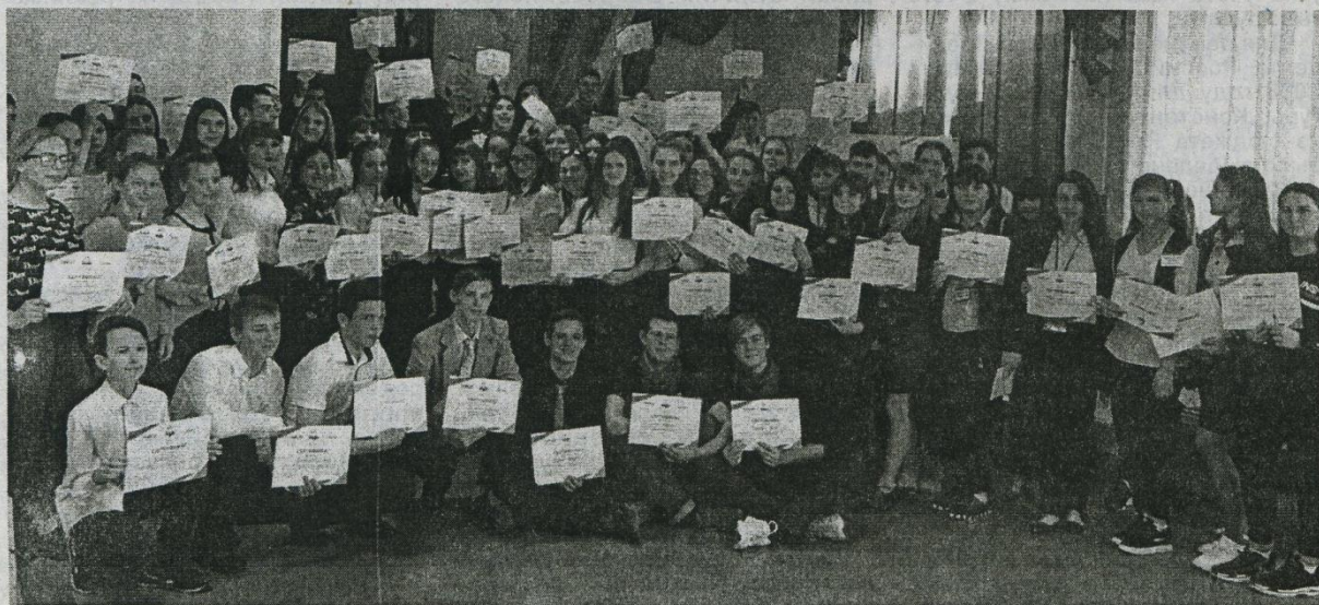
Участники площадки проекта в РДК.

Региональный проект «Молодежная команда Губернатора» традиционно собрал в РДК на своей площадке 100 самых инициативных ребят из образовательных организаций и учреждений профессионального образования нашего района.