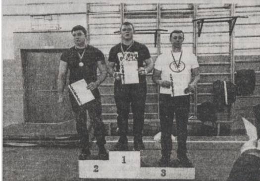
Победители на пьедестале.

норм ГТО первое место заняла команда КонстПК, второе место - КТАУ, третье - Николаевского с/п.