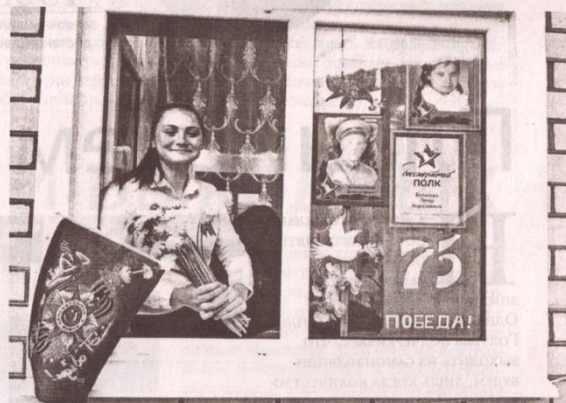
Акция «Окна Победы».

В День Победы к Мемориалу воинов-освободителей воз-