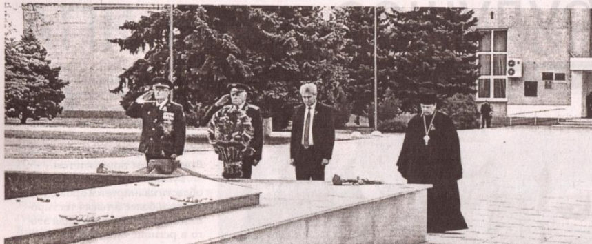
Возложение цветов к Вечному огню - 9 мая 2020 года.

9 Мая жители Константиновского района вместе со всей страной отметили юбилей Великой Победы. В этом году он прошел по-особому, без привычных нам широких массовых мероприятий.