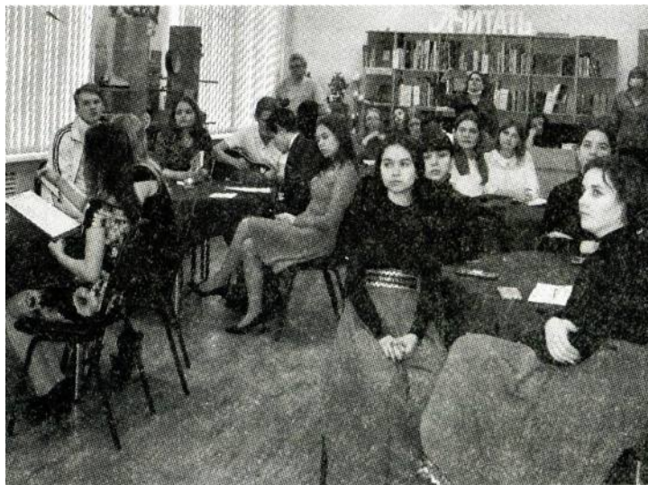
Участники вечера поэзии.