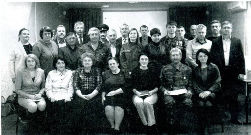
Участники областного семинара-практикума в Константиновском педколледже.

На базе Константиновского педагогического колледжа состоялся областной семинар-практикум по поисковой работе в образовательных учреждениях, посвященный 80-летию начала Великой Отечественной войны.