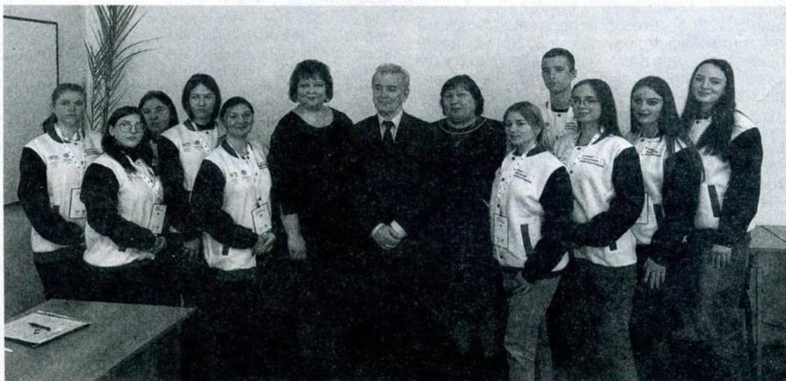
На открытии Консультационного пункта в техникуме КТАУ (КСХТ).

Сразу три средних специальных учебных заведения города Константиновска - технологический техникум, техникум агротехнологий и управления и педагогический колледж стали участниками федерального проекта «Цифровое правосознание налогоплательщика».