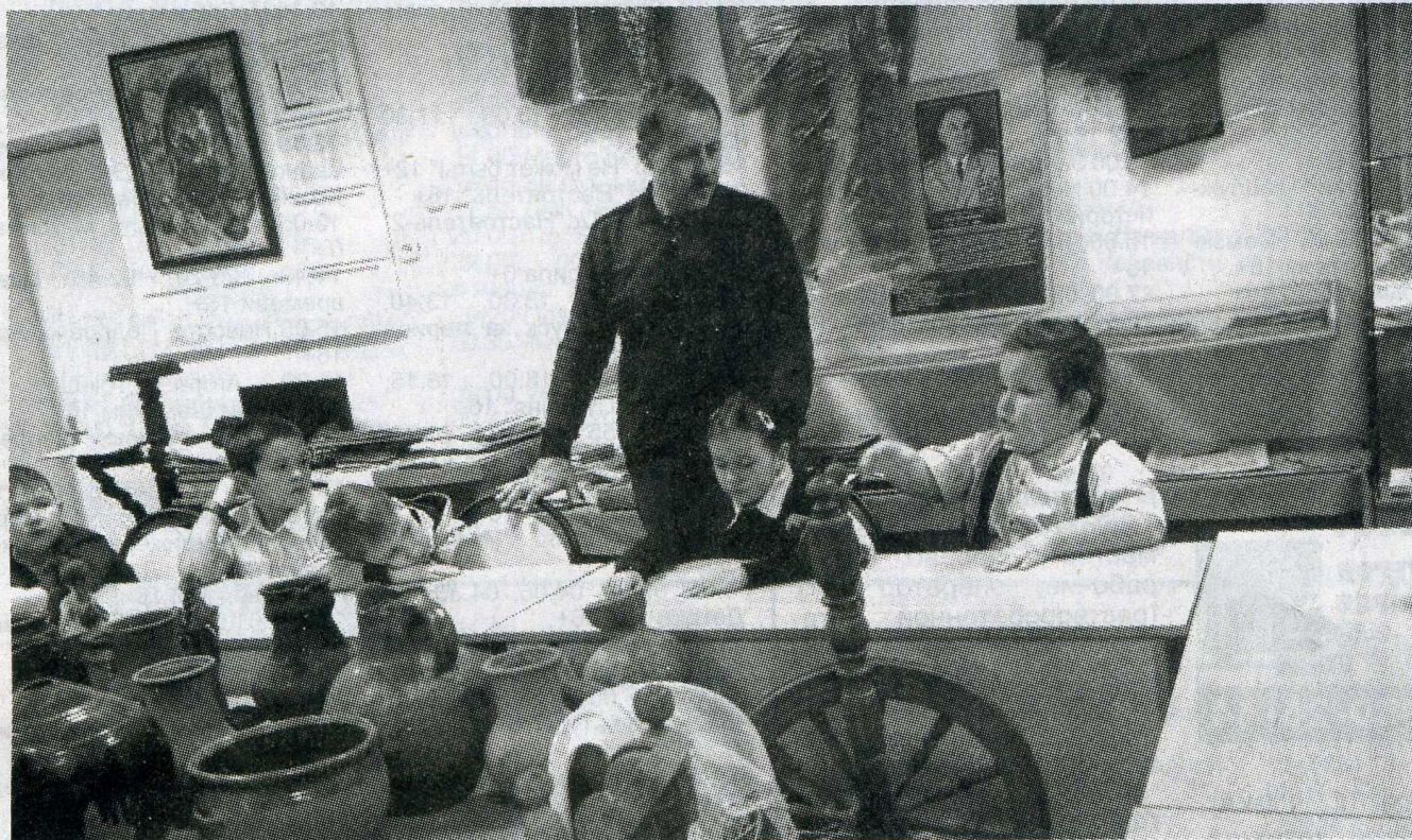
В музее педагогического колледжа.

Константиновские школьники посетили музей педагогического колледжа.