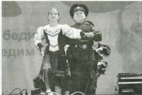
На сцене - хореографический коллектив ДШИ "Непоседы".

Завершилось мероприятие красочным финалом, единением зрителей и артистов. В зрительный зал во время исполнения народным коллективом «Атаман» песни «Россия» с флажками Российской Федерации в руках вышли все участники концерта. Люди