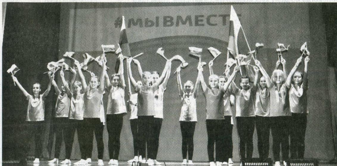
На сцене - хореографический коллектив КДШИ "Новое поколение".

Много прекрасных песен, стихотворений о Великой Отечественной войне, о Родине, о солдатах прозвучало в этот день со сцены. Были исполнены трогательные танцевальные композиции. Артисты представили на суд зрителей более 20 концертных номеров. Выступления участников были настолько проникновенными и