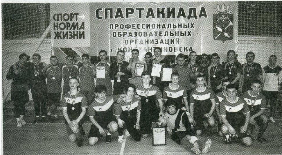
На церемонии награждения.

В физкультурно-оздоровительном комплексе прошло торжественное награждение победителей и призеров спартакиады среди студентов профессиональных образовательных учреждений нашего города.