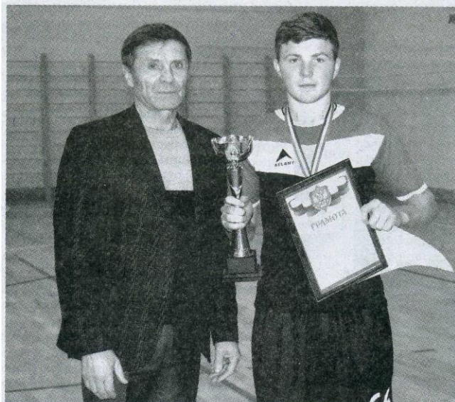
Вручение кубка команде КонстПК.