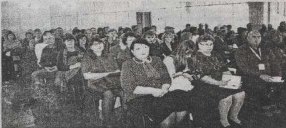
На пленарном заседании краеведов.