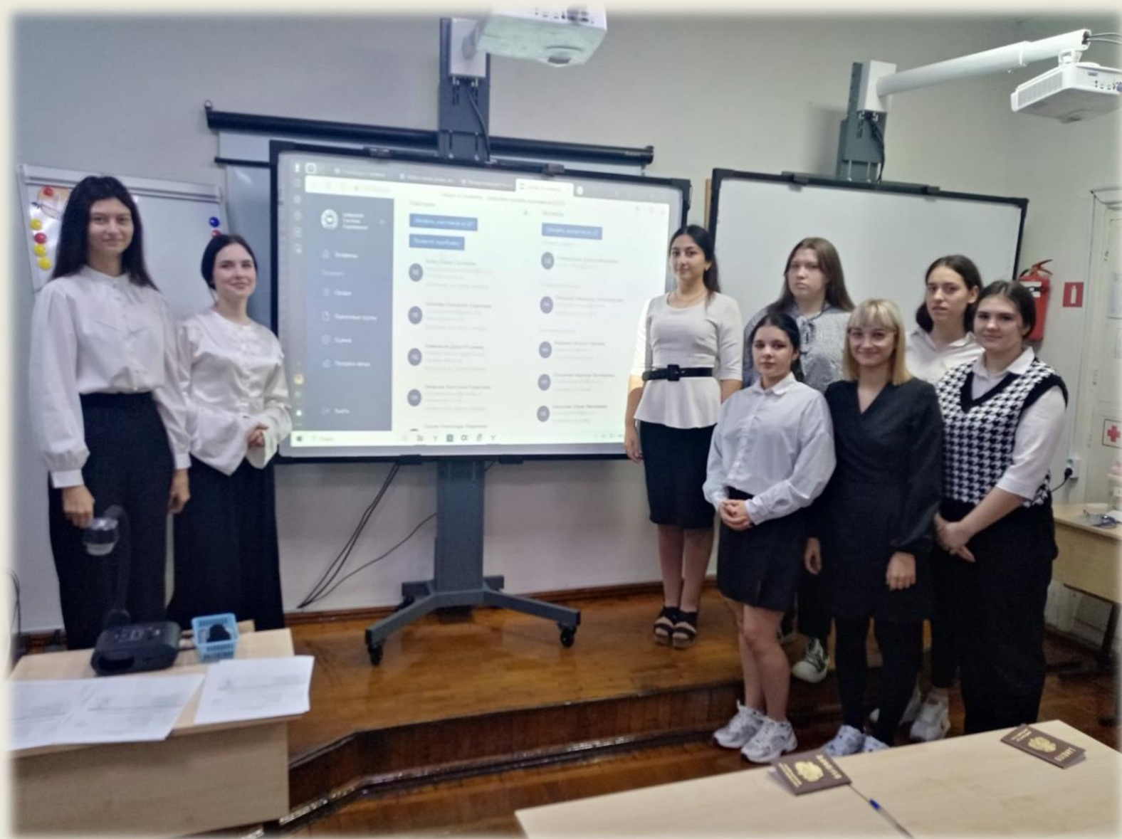
Фото с экзамена