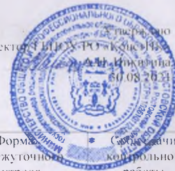
ГРАФИК УЧЕБНОГО ПРОЦЕССА НА 2021-2022 УЧЕБНЫЙ ГОД специальность 44.02.05 Коррекционная педагогика в начальном образовании (1 курс ОЗО)