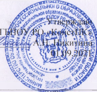
ГРАФИК УЧЕБНОГО ПРОЦЕССА НА 2021-2022 УЧЕБНЫЙ ГОД специальность 44.02.01 Дошкольное образование группа (2 курс ОЗО)