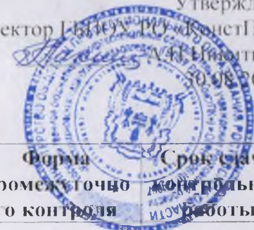
ГРАФИК УЧЕБНОГО ПРОЦЕССА НА 2021-2022 УЧЕБНЫЙ ГОД специальность 44.02.01 Дошкольное образование (3 курс ОЗО)